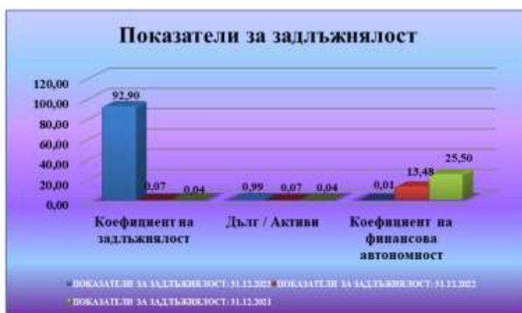
Таблица № 7