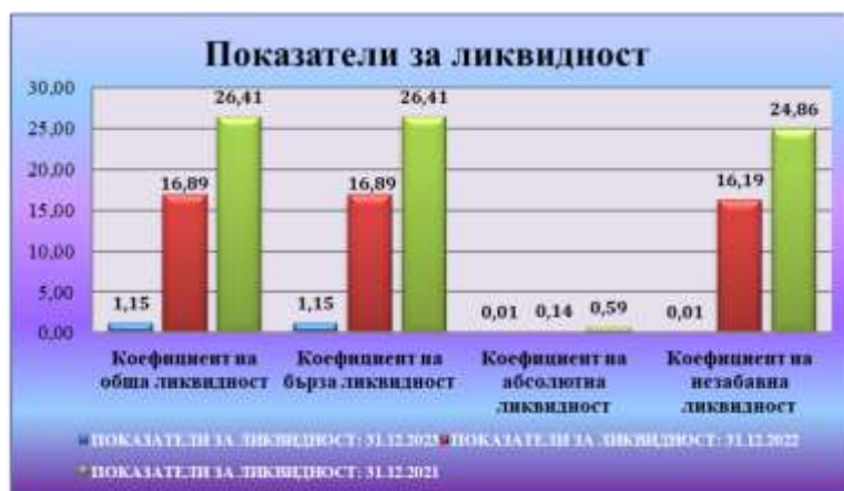
Таблица № 6