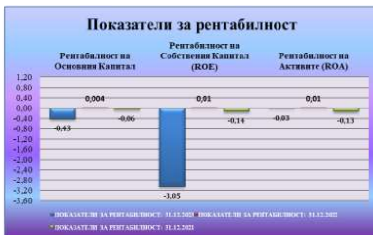
Таблица № 8