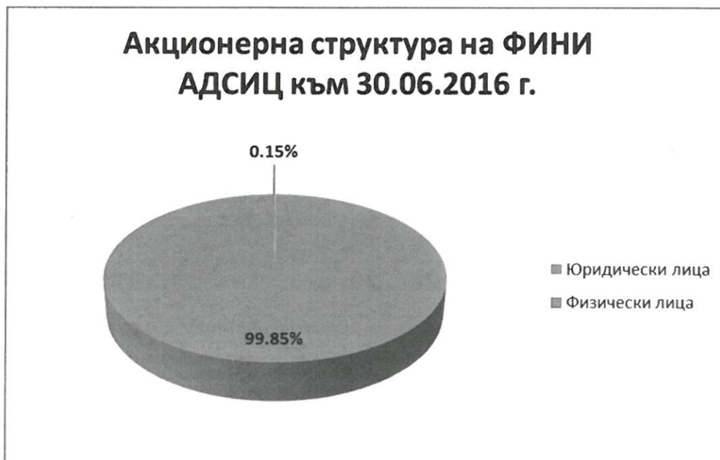
Структура на капитала на Емитента към 30.06.2016 г.