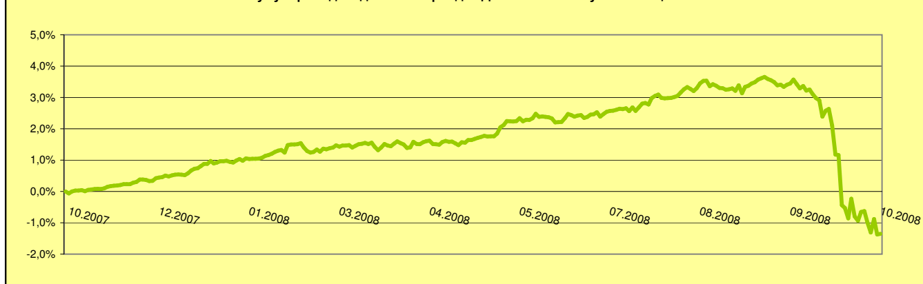
Кумулирана доходност за периода - ДФ "ОББ Платинум Облигации"

В началото на изминалия месец глобалната финансова криза разшири своето негативно развитие в Европа, развиващите се пазари в Азия. Кредитните пазари бяха замразени в резултат на липсата на доверие между финансовите институции след фалита на четвъртата по големина американска инвестиционна банка Lehman Brothers. Последва бърза реакция от страна на държавните институции, които целяха стабилизиране на финансовите пазари и връщане на доверието. Представители на централните банки и финансовите министерства ясно заявиха, че ще предприемат всички възможни мерки за преодоляването на кризата. Сената и Конгреса в САЩ приеха план на стойност 700 млрд. долара за изкупуване на лоши активи от банките, подобни мерки бяха взети и от европейските лидери. Централните банки Европа, САЩ и Азия редуцираха рязко основните лихвени проценти с цел да повишат доверието и да наляят допълнителна ликвидност в системата. Всички тези мерки започнаха да дават резултат, като индексите по света се стабилизираха, а лихвените проценти на междубанковия пазар започнаха да падат.