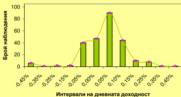
Разпределение на дневната доходност