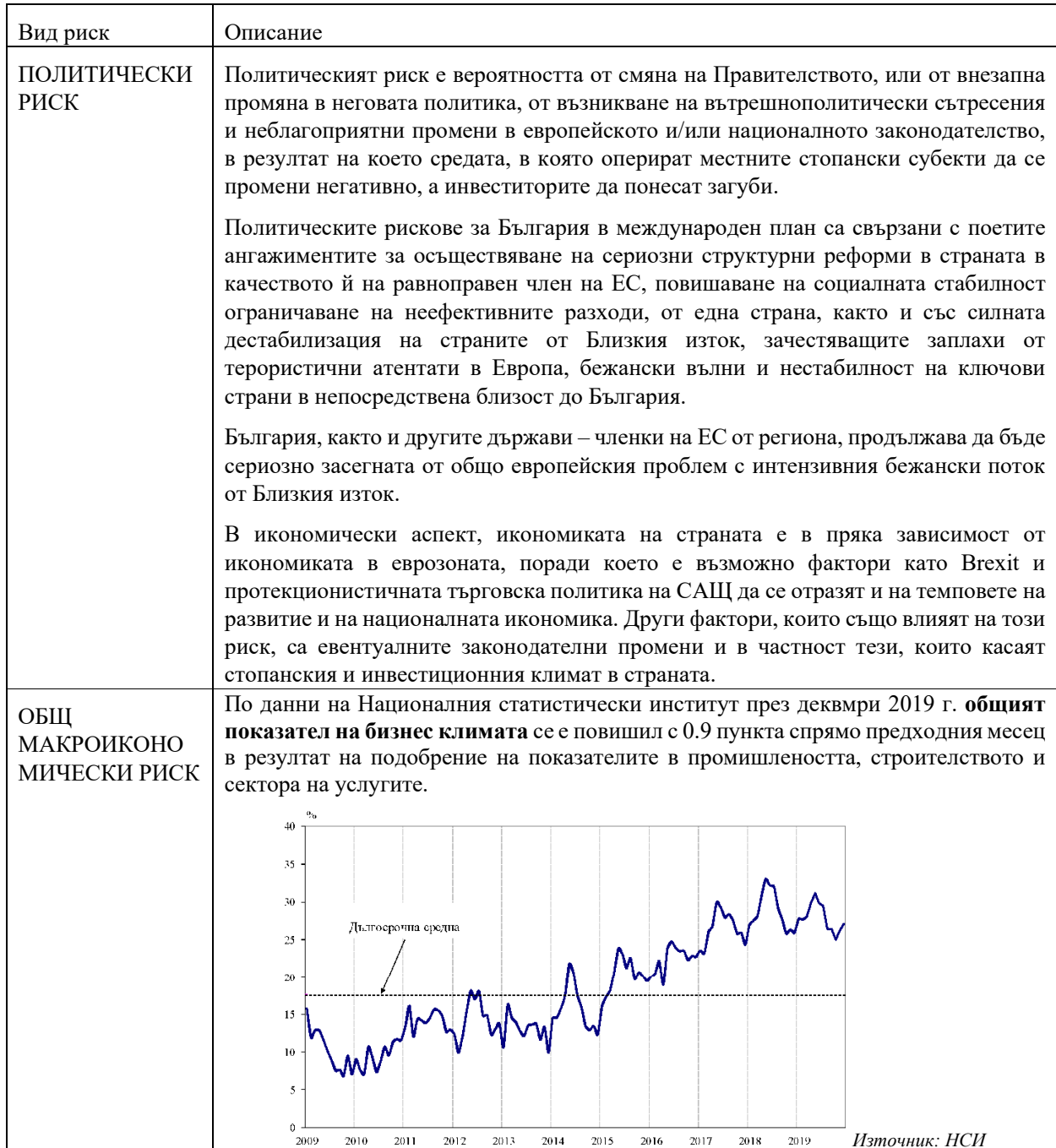
Таблица No 10

Систематичните рискове са свързани с пазара и макросредата, в която Дружеството функционира, поради което те не могат да бъдат управлявани и контролирани от мениджмънта на компанията екип. Систематични рискове са: политическият риск, макроикономическият риск, инфлационният риск, валутният риск, лихвеният риск, данъчният риск и риск от безработица.